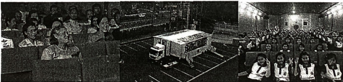
สมเด็จพระกนิษฐาธิราชเจ้า กรมสมเด็จพระเทพรัตนราชสุดาฯ สยามบรมราชกุมารีฯ

ปัจจุบันโรงภาพยนตร์ส่วนใหญ่ใช้ในทางธุรกิจและบันเทิงเป็นหลัก เนื่องจากผู้ประกอบการโรงภาพยนตร์เท่านั้นที่จะมีโรงภาพยนตร์ ประเทศไทยมีโรงภาพยนตร์ประมาณ ๗๐๐ โรง ซึ่งประมาณ ๒๐๐ โรงอยู่ในกรุงเทพฯ โรงภาพยนตร์เหล่านี้ฉายหนังในฐานะเป็นสินค้าขายความบันเทิง และดำเนินกิจการเป็นระบบเครือข่าย ผูกขาดอยู่ไม่กี่ราย ประชาชนไทยจึงถูกสร้างนิสัยให้ติดการชมภาพยนตร์ในฐานะสินค้าบันเทิงตามลัทธิบริโภคนิยม ไม่มีโอกาสได้ชมภาพยนตร์ที่หลากหลายในโลกนี้ และเรียนรู้จากภาพยนตร์เพื่อยังให้เกิดปัญญา ส่วนในหน่วยงานของรัฐมักจะมีพื้นที่เป็นลักษณะของห้องที่ใช้ในหลายลักษณะเชิงเอนกประสงค์หรือเผยแพร่ความรู้ตามภารกิจของหน่วยงาน แต่ที่จะใช้ภาพยนตร์เป็นสื่อในการสร้างปัญญายังมีน้อย มีเพียงสถานศึกษาบางแห่งที่เข้าใจถึงประโยชน์ของภาพยนตร์ จึงจัดกิจกรรมในการชมภาพยนตร์ร่วมกัน กระนั้นก็ตามยังไม่มีพื้นที่ที่เป็นโรงภาพยนตร์จริง ๆ มีหน้าซ้อยังทยอยปิดตัวลงเป็นจำนวนมาก ประกอบกับคนส่วนใหญ่เริ่มใช้ชีวิตที่ส่วนตัวมากขึ้น การชมภาพยนตร์ก็จะเป็นการชมในครอบครัวจากแผ่นดีวีดีหรือจากสถานีโทรทัศน์ต่าง ๆ รวมถึงเคเบิล ดาวเทียม ออนไลน์ หรือสตรีมมิ่งซึ่งมีให้เลือกมากมาย เยาวชนในปัจจุบันใช้เวลาในการชมภาพยนตร์น้อยลง แต่ใช้เวลาในการชมโทรทัศน์เป็นส่วนใหญ่ โดยในเวลาดังกล่าวอาจจะไม่มีผู้ปกครองช่วยแนะนำเนื้อหาที่เหมาะสม หรือสร้างความเข้าใจที่ถูกต้องให้กับเยาวชน ในเวลาที่เยาวชนอยู่โรงเรียนก็ไม่มีกิจกรรมเสริมสร้างการรู้เท่าทันสื่อหรือภาพยนตร์ จึงควรให้เยาวชนมีการเรียนรู้จากภาพยนตร์อย่างถูกต้อง