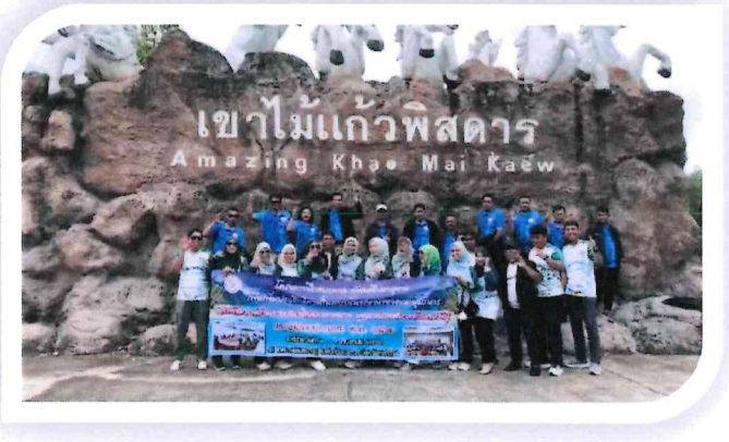
***มอบของที่ระลึกและถ่ายภาพร่วมกัน***