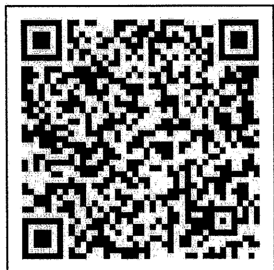
สแกน QR-Code เพื่อสมัครเข้าประกวด