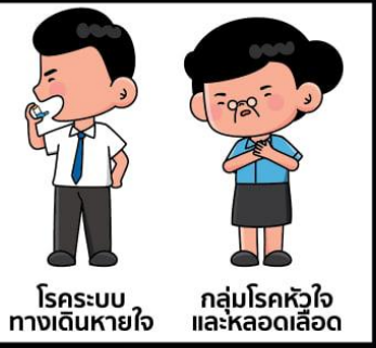
กลุ่มโรคหัวใจ และหลอดเลือด