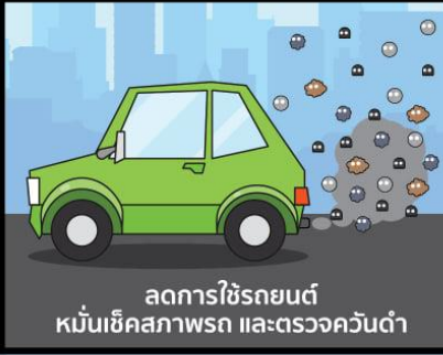
ลดการใช้รถยนต์ หมั่นเช็คสภาพรถ และตรวจควันดำ