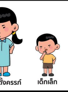
โรคระบบ ทางเดินหายใจ