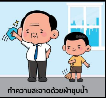
ทำความสะอาดด้วยผ้าชุบน้ำ