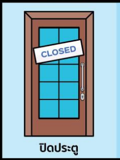
ปิดประตู