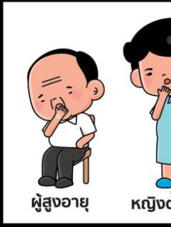
ผู้สูงอายุ