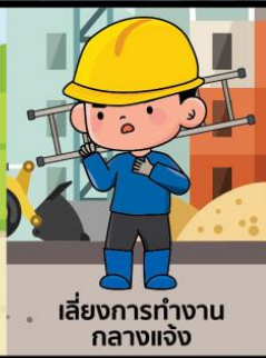
เสี่ยงการทำงาน กลางแจ้ง