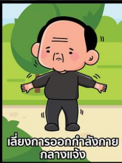
เสี่ยงการออกกำลังกาย กลางแจ้ง