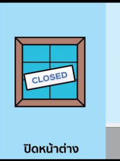
ปิดหน้าต่าง