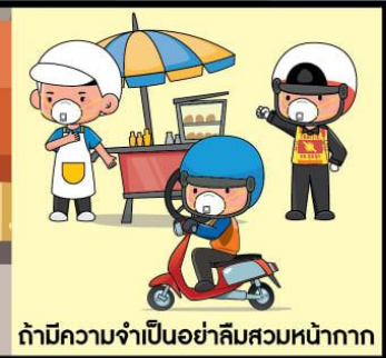
ถ้ามีความจำเป็นอย่าลืมสวมหน้ากาก